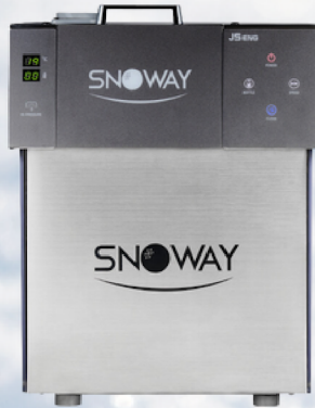
カフェ・レストラン向き