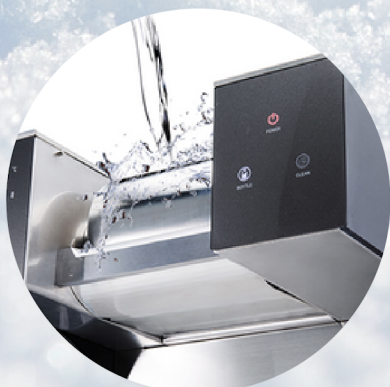
水洗いもカンタン

SNOWWAYは予熱を必要とせず、電気ポットを使用するようにボタンを押すだけ。氷も不要です。 牛乳、ジュース、ビール、マッコリ、ワインなどの液体原料を注ぐだけで、きれいなパウダー雪花氷がわずか20秒で作れます。