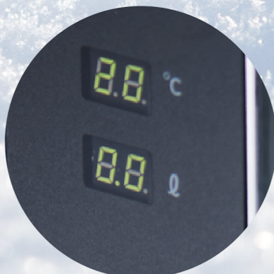
デジタルディスプレイ